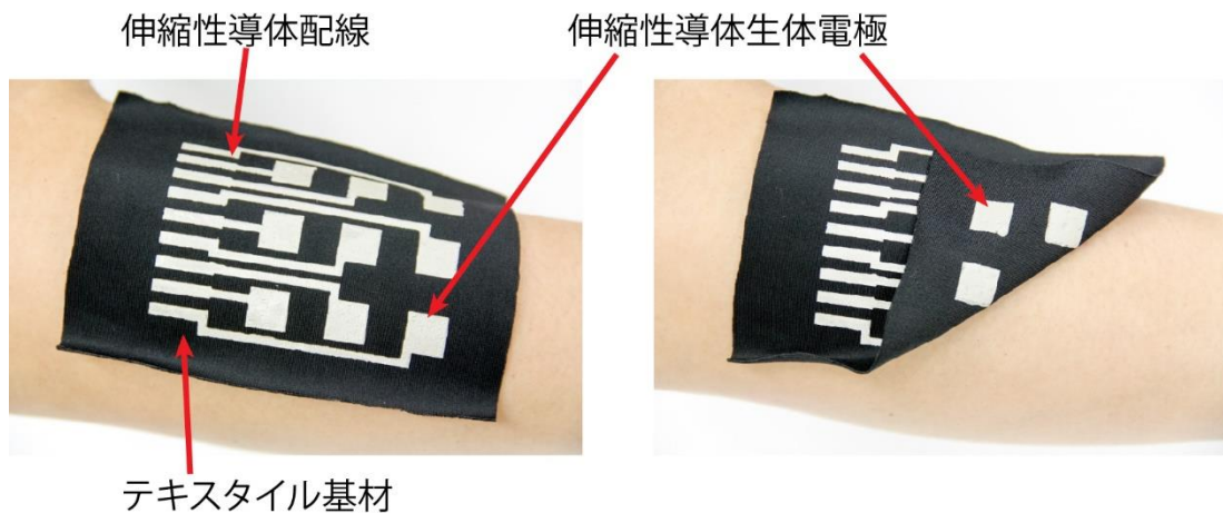
図2 プリントするだけで作製したテキスタイル型の筋電センサー

1回のプリントでゴムや繊維の上に微細なパターンの伸縮性導体を形成できる。上段は元の長さの伸縮性導体。中段は元の長さの約2倍に伸ばした状態で、下段は3倍強に伸ばした状態。元の長さより3倍以上伸張しても導電性は維持されている。